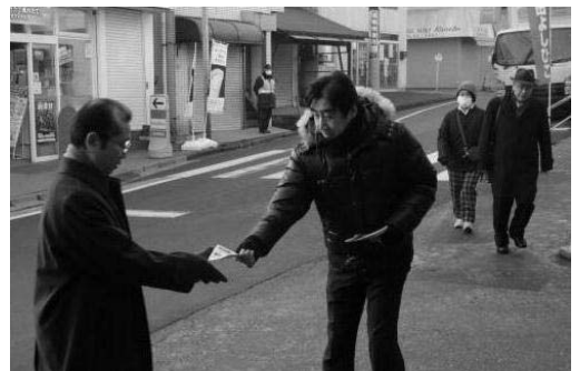
平成27年2月6日 馬込沢駅で

ストセラーにもなっていますので、すでにお読みになった方もいらつしやるでしょう。本書では、少子高齢化の影響で「人口急減」が起こる数十年後の日本の姿、千葉県北西部を含む大都市圏に人口が集中して大都市圏は高齢化率35%を超える超高齢社会(3人に1人が高齢者)になり、地方では89.6以上の市町村が「消滅」と書かれています。