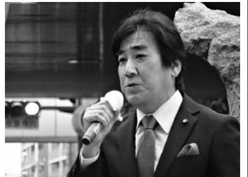
平成26年11月8日 船橋駅で街頭演説

継いでいきたいと思えます。今、民主党への支持率はひとケタ台ですから非常に厳しい戦いになることでしょう。私はそれに立ち向かう決心をしました。そして、これまでと同様に政治の諸課題を解決するため、市民の皆様、県民の皆様のために尽力することをお誓い申し上げます。